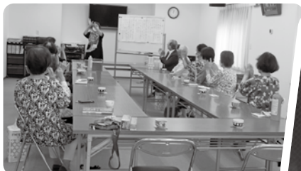
陵南町地区 ふれあい集会