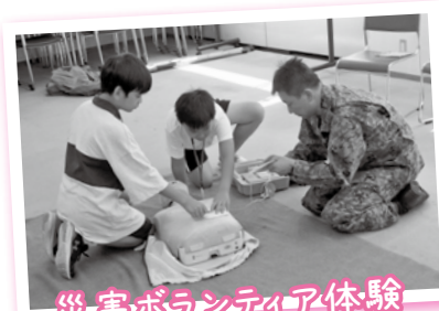
災害ボランティア体験