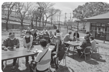
梅が園町地区 カフェ