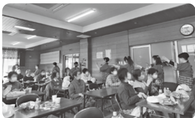
大井地区 高齢者の集い