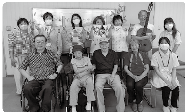
「ちょっと覗いてみようかな?」「見学だけ…」 もちろん大歓迎です!!