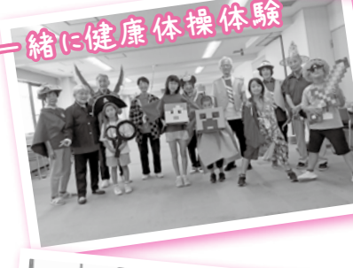
一緒に健康体操体験