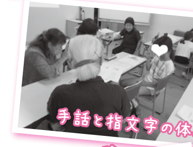
手話と指文字の体験