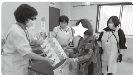
小山地区 ふれあいお楽しみ抽選会

社会福祉法人 藤井寺市社会福祉協議会 〒583-0035 藤井寺市北岡1-2-8 ふれあいセンター(福祉会館)内 TEL 072-938-8220 FAX 072-938-8221 http://www.fujiidera-shakyo.net E-mail fureai@silver.ocn.ne.jp