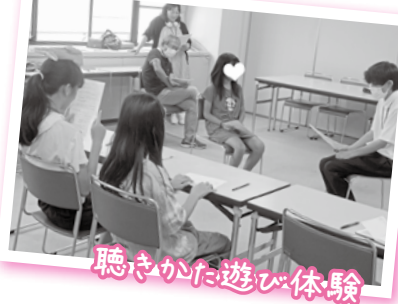
聴きかた遊び体験