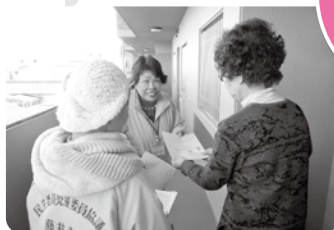
道明寺地区 見守り声かけ訪問