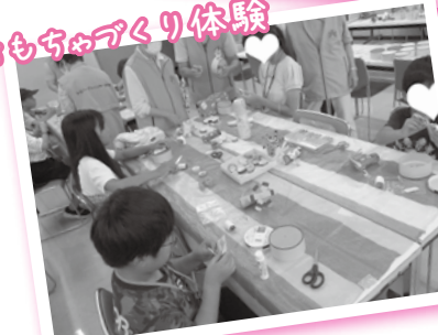
おもちゃづくり体験