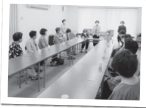
福祉委員さんの挨拶

者同士、福祉委員さんをはじめ地区の関係者の方と顔を合わせ、笑顔で冗談を言い合って楽しくすごされていきました。新型コロナウイルスの感染予防の意識も高くしながら、検温、消毒、マスク着用はもちろんのこと、大きな声を出さないようなプログラム(ビンゴゲームや手話歌や指体操等)が組まれていました。加えて、食事はお弁当を持って帰っていただくことで、マスクを外した会話にならないような工夫もされていきました。 陵南町地区では、今年度は福祉委員さんのメンバーが替わられたこともあり、「皆さんに楽しんで頂けるかな」と心配されていましたが、盛況の中で会は終了しました。