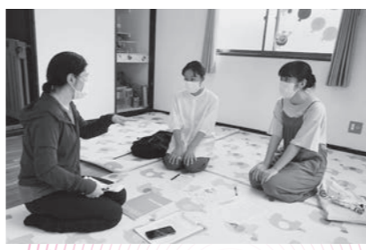
ボランティア活動の説明を受けている様子