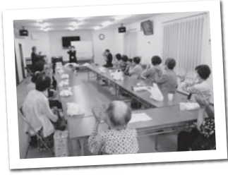
手話歌を楽しまれていました

コロナ感染症が少し落ち着いた時期であった令和4年7月9日(土)に、陵南町地区の会館で「ふれあい食事会」が開催されました。参加者の皆さんは「待ってました!」と言わんばかりに、参加