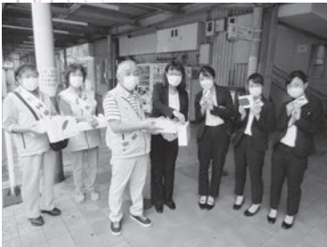
昨年度の街頭募金の様子