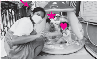
保育園で水遊びする乳幼児の 見守りボランティア活動の様子

活動をしています。 「自分のできることをボ ランティアで活かした い」と思っているかたは、 ボランティアセンターへ ご相談ください。 あなたの時間を地域に 役立てましょう！