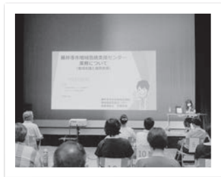
地域包括支援センターの紹介

2年に一度の一次改選に伴い、令和4年度から新しく福祉委員になられた方向けに、新型コロナウイルス感染症防止対策を行った上で、研修会を開催しました。