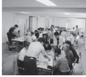
前回の住民懇談会の様子♪

皆さんが集まり、意見 を出し合っ て頂く、住民 懇談会を開催します。詳 細は準備中ですが、市内 で活躍されている、より 多くの団体さんに参加し て頂き、皆さんの生の声 をお聞きしたいと思っ ています。