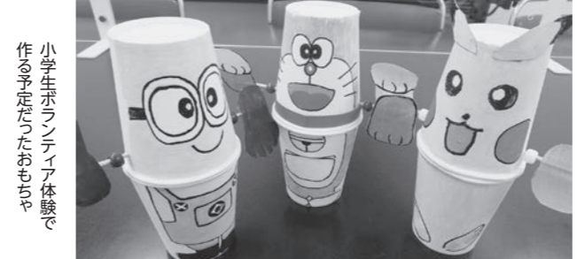
小学生ボランティア体験で 作る予定だったおもちゃ

7月号の社協だよりで 掲載しました「小学生ボ ランティア体験demiニ サマーフェスタ」が、新型 コロナウイルス感染拡大 予防のため中止となりま した。 2年連続の中止として も残念ですが、たくさん お申し込みありがとうございました。 来年こそは、皆さんに 会おうのをとても楽しみに しています。