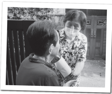
細やかな対応の様子

新型コロナウイルス感染拡大防止に伴う不要不急の外出制限が要請されて、約1年半が経とうとしています。そのあおりを受け、地域での集いや食事会は軒並み中止・延期となり、日頃からの顔の見える関係作りの維持の必要性が改めて問われています。