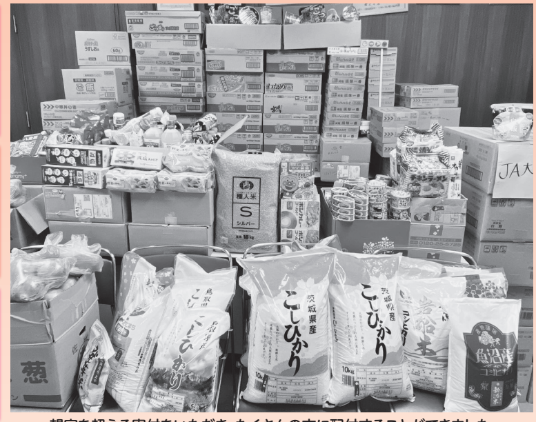
想定を超える寄付をいただき、たくさんの方に配分することができました。