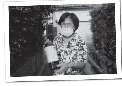
暑いのでお茶を配りました

「いつもはスポーツドリンクをこの時期に配付するのですが、今年はお茶を希望される方がいて、福祉委員で話をしてお茶にしたいんです。」と笑顔で取材に答えて頂いた