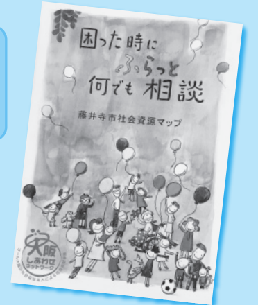
完成したマップの表紙

このマップを起点として、社会貢献事業を支える藤井寺市社会福祉施設の会員施設の紹介、地域住民同士の身近な社会資源についての話し合いと、社会資源の情報を必要とする市民への情報提供のきっかけとなればと考えています。