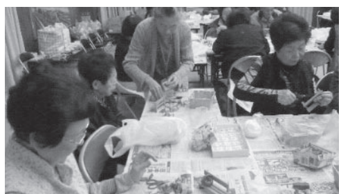
助け合いながら楽しみながら活動は続きます

来場者の方々一人ひとりに笑顔で声をかけられる福祉委員のみなさん。当日は、48名の方が参加。他地区のグループ活動でも男性には敬遠されやすい「手作り」という活動でも地区に定着した行事になっていて、常連で出席される男性の姿も。「毎回違うものを作るから楽しみにしていますね。前に作った置物も今でも大事にしているんですよ。」と笑顔で答えて下さいます。