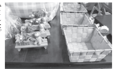
完成のイメージがつきやすいように事前に作品を展示しました。

当日は、かわいい犬の置物がついたベンチと植木の置物と、小物が入る籠のアレンジメントを行