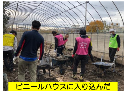
ビニールハウスに入り込んだ泥のかき出し

各地の災害ボランティアセンターでは、被災された方々から寄せられるニーズへの対応が進んだことで、ボランティアの募集対象地域を当該県内・市内に限らせていただいたり、週末を中心とした活動や、事前登録・受付を行うことで被災された方々の要望に沿った活動を進める状況に変化しつつあります。