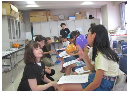
ボランティア体験の様子