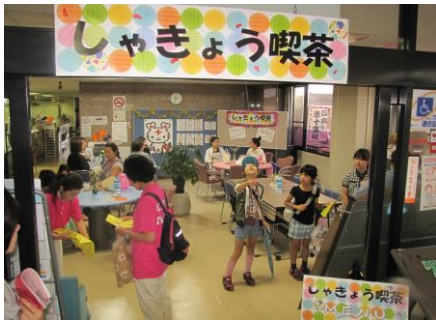
今年からオープンした社協喫茶

小雨が続くあいにくの天気となった6月19日 日曜日。 そんな悪天候にも関わらず、藤井寺市施行50周年記念と銘打った藤井寺市地域サービス公社・藤井寺市社会福祉協議会・イベントサークルクローバーが共催で実施した初のフェスタには、予想を上回1,000名以上の方にご来場いただくことができました。