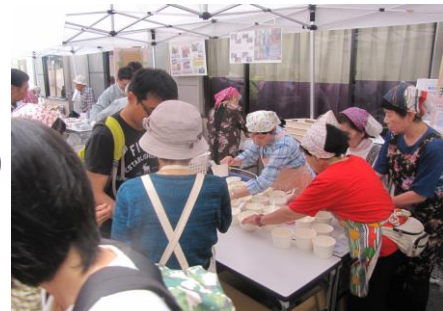
災害食コーナーの様子

社協フェスタ側では、ボランティア団体の発表や体験コーナー・災害食コーナー・スタンプラリー・ミニSLコーナー・しゃきょう喫茶などに人が集まり盛り上がりを見せていました。今後も、関係機関や各種団体と協力しながら、イベントを通じて、ボランティアのこと、社会福祉協議会のことをより多くの市民の方に啓発できたらと考えています。前日、当日とお手伝い・ご協力いただいた個人・団体のボランティアさんに厚くお礼を申し上げます。ありがとうございました。