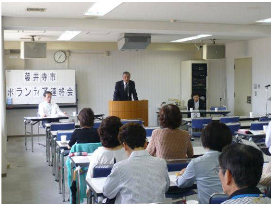
松田会長からのあいさつ