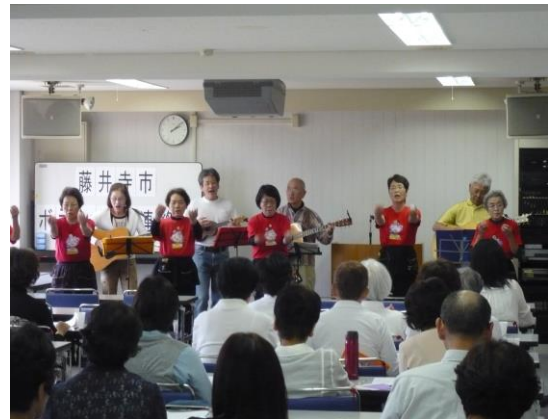
レクリエーションの様子