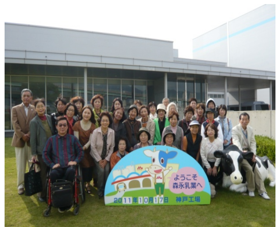
森永神戸工場前にて

今後も、このような交流会を通して、ボランティア同士のつながりが深まればと考えています。